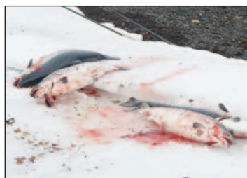
HEMMELIG: Forklaringen på hvorfor politiet har etterforsket en sak der Grieg seafood har innrømmet skyld for å ha mistet 15.000 fisk, ser ut til å bli en hemmelighet. (Arkivfoto)

Statsadvokaten ønsker ikke å fortelle hva politiet har forklart rundt tidsbruken under etterforskningen av lakserømmingen i fjor.